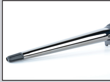
Flat Curl 250 Tenacilla cónica plana.